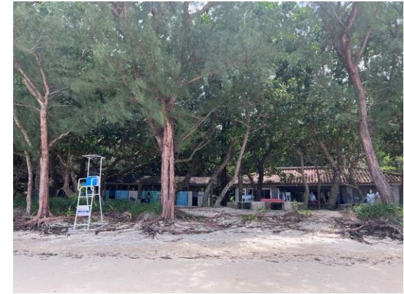
砂浜が侵食され、むき出しになったモクマオウの根