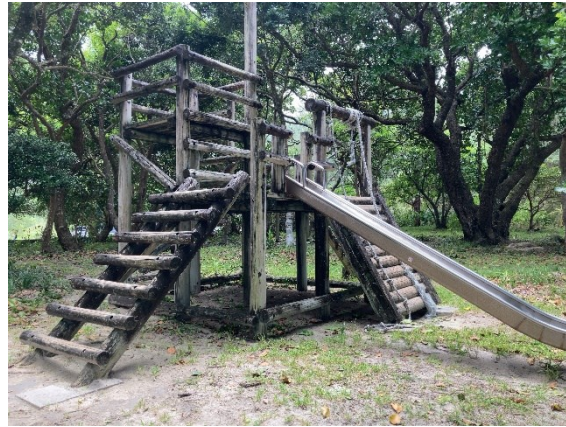
老朽化した木製遊具