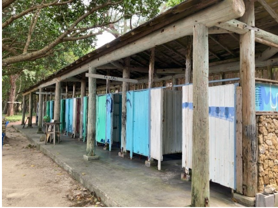
老朽化したシャワー施設