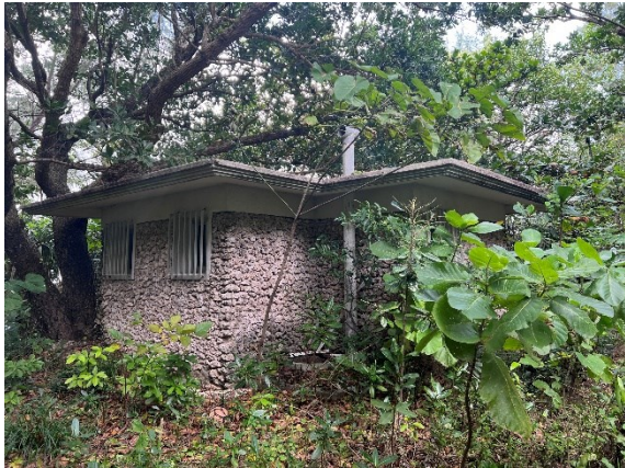
老朽化し、使用されていないトイレ