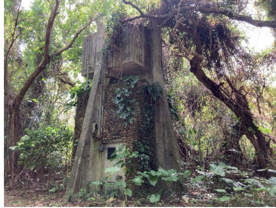
老朽化し、使用されていない給水塔