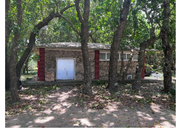
活用されていない倉庫