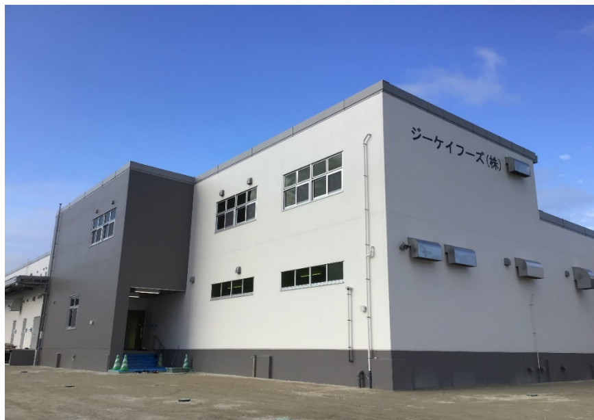
【主要設備】加熱水蒸気オーブン、加熱攪拌機、連続式炊飯器等